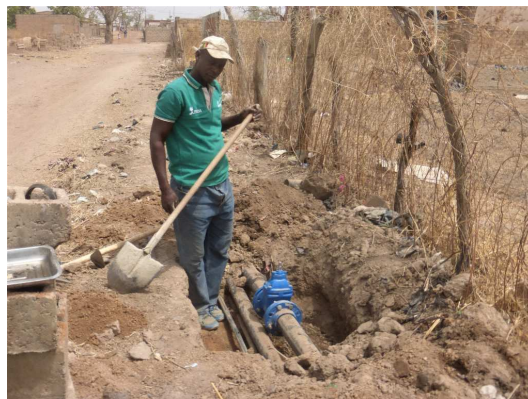
Construction des canalisations

A Koussanar, dans la région de Tambacounda, les travaux du lot 4 sont en cours de finition: construction des abris, des vannes et des ventouses. Les activités de sensibilisation sont en préparation, la mise en place des Comités d'Hygiène et de Salubrité ne saurait tarder, ainsi que l'élaboration des plans d'action. Mais l'activité phare reste le traitement des demandes de branchement domestiques. Les populations disposent maintenant de robinet, comme le montrent les photos.