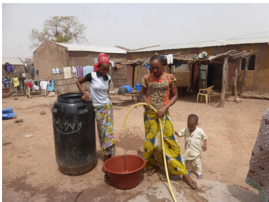
L'eau à domicile