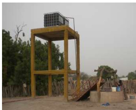
Projet de puits et château d'eau