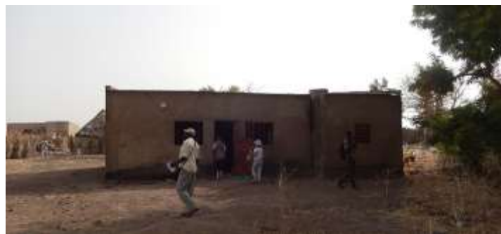
Logement de l'infirmier