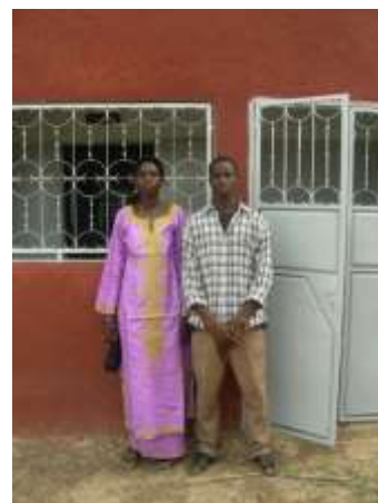
Infirmier et matrone