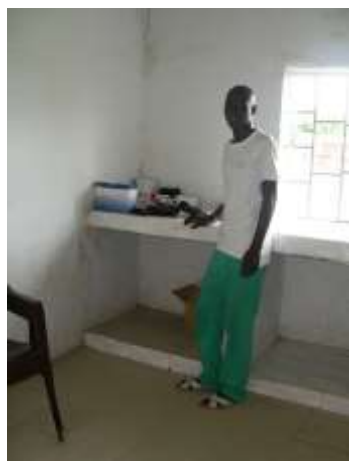
Pharmacie – état actuel