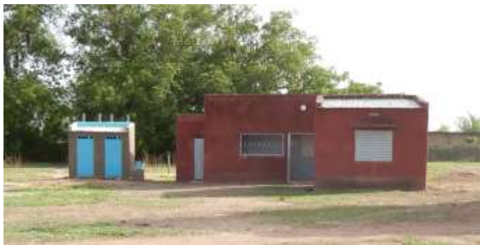
Poste de Santé – vue générale