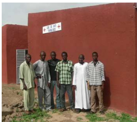
Comité local de santé