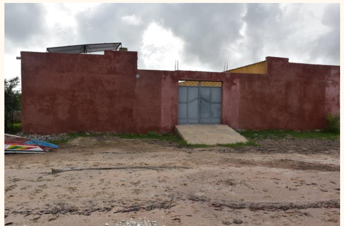
Unité de Palmarin