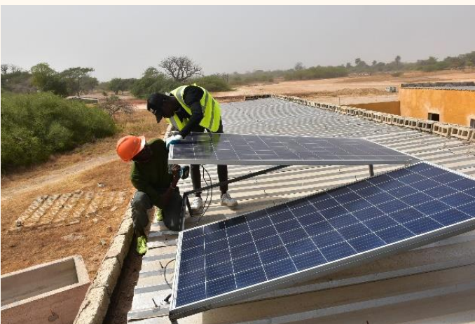
Installation des panneaux solaires