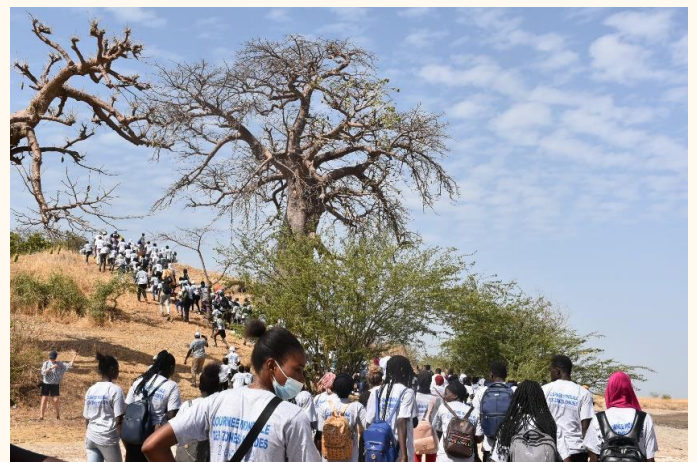
Visite de terrain des collines de Niassam