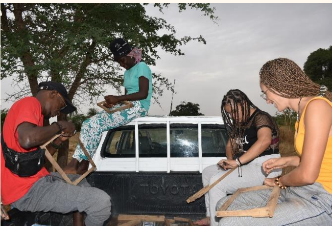
Fabrication des cadres de bois dans les ruches de Palmarin