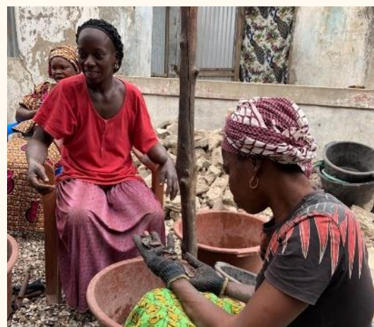
Nettoyage des huîtres à Falia

L'écriture de ce projet est partie des problématiques de l'épuisement progressif des ressources naturelles de coquillages, et des conditions de travail dangereuses pour les femmes et les enfants qui les accompagnent. Ce projet a également pour but de supprimer les intermédiaires dans la vente des produits.