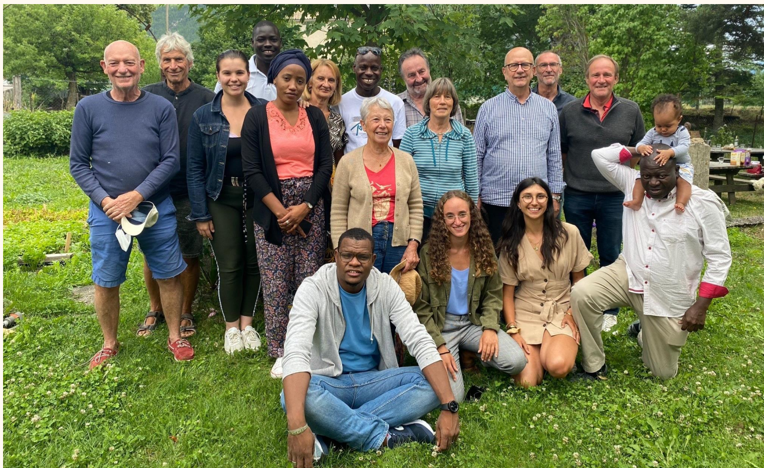
Participants au séminaire 2022